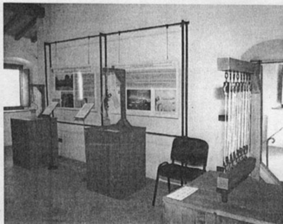
Alcuni dei modelli delle macchine funzionanti tratte dai codici di Leonardo da Vinci esposte fino al 7 gennaio all'Eco Museo di Mora Bassa

Una mostra sulle macchine progettate da Leonardo, nella città che ha ospitato il grande genio toscano. L'iniziativa, inaugurata domenica scorsa nell'ambito della manifestazione «Vigevano è», è stata organizzata da «Welcome at your service» - la società vigevanese che si occupa di turismo, web e promozione nata dal corso di formazione «Progetto Castello», finanziato dalla Regione e dalla Ue - in collaborazione con